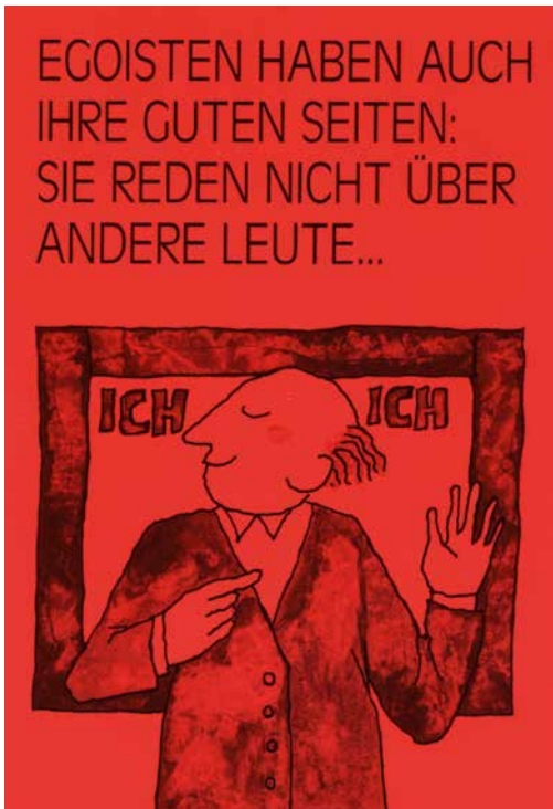
Kunstverlag Maria Laach, Nr. 56653